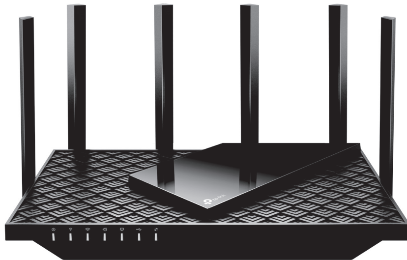
AX5400 Wi-Fi 6 路由器